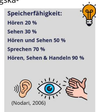
Abb. 2: Speicherfähigkeit